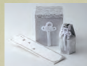
骨壺・骨箱セット