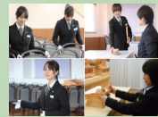
進行運営 スタッフ1名