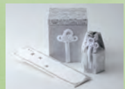
骨壺・骨箱セット