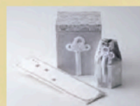
骨壺・骨箱セット