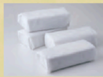
ドライアイス(1日分)