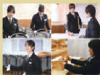
進行運営 スタッフ1名