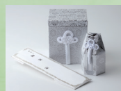
骨壺・骨箱セット