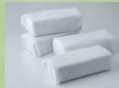
ドライアイス(2日分)