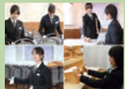
進行運営 スタッフ1名

※寝台車は夜間(22時~翌朝6時)のお迎えの場合、夜間料金 18,000円(税別)が別途必要となります。 ※寝台車・霊柩車が20kmを超える場合、5km毎に6,000円(税別)の費用がかかります。