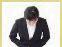
火葬場案内 スタッフ1名

※寝台車は夜間(22時~翌朝6時)のお迎えの場合、夜間料金12,000円(税別)が別途必要となります。 ※寝台車・霊柩車が20kmを超える場合、5km毎に6,000円(税別)の費用がかかります。