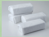
ドライアイス(2日分)